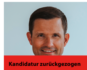
Kurt Mike Swiss Canoe