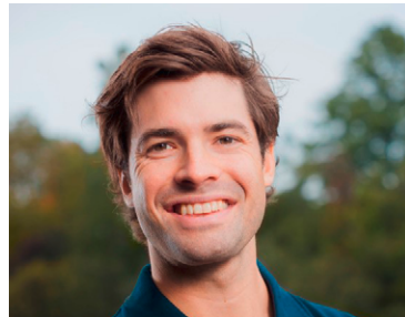
Gyr Mario Schweizerischer Ruderverband