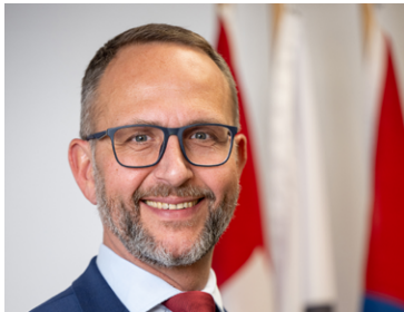
Gobbi Norman Schweizer Schiesssportverband SSV