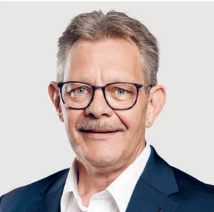
Franz-Josef Amherd Präsident des Verwaltungsrats