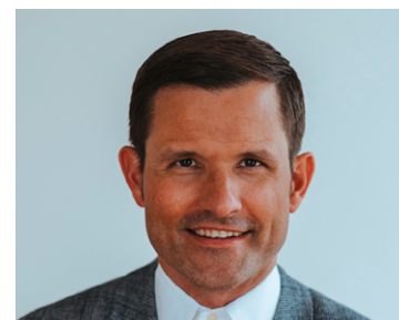
Kurt Mike Swiss Canoe