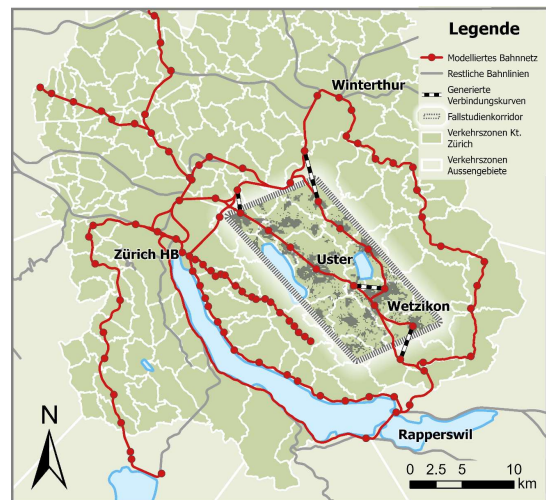
Abb. 2: Fallstudienkorridor Dübendorf - Hinwil mit modelliertem Bahnnetz und Verkehrsnachfrage sowie notwendige Verbindungskurven für generierte Angebotsausbauten.

Das Tool besteht aus vier Modulen: Generierung von Ausbauten: Verlängerung von Linien und neue Linien zur Verbindung von Korridoren werden algorithmisch generiert. Die zukünftige Umwelt wird durch 100 explorative Szenarien abgebildet. Daraus wird die Verkehrsnachfrage auf die ausgebauten Bahnnetze umgelegt. Schlussendlich wird eine Bewertung durchgeführt, welche Bau-, Unterhalts- und Betriebskosten sowie Nutzen wie Reisezeit-ersparnisse beachtet. Jede Ausbaute wird in jedem Szenario bewertet, um die Auswirkungen zukünftiger Unsicherheiten in den Ergebnissen abzubilden.