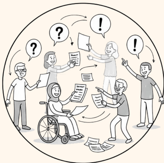
Transparenz und frühe Befassung