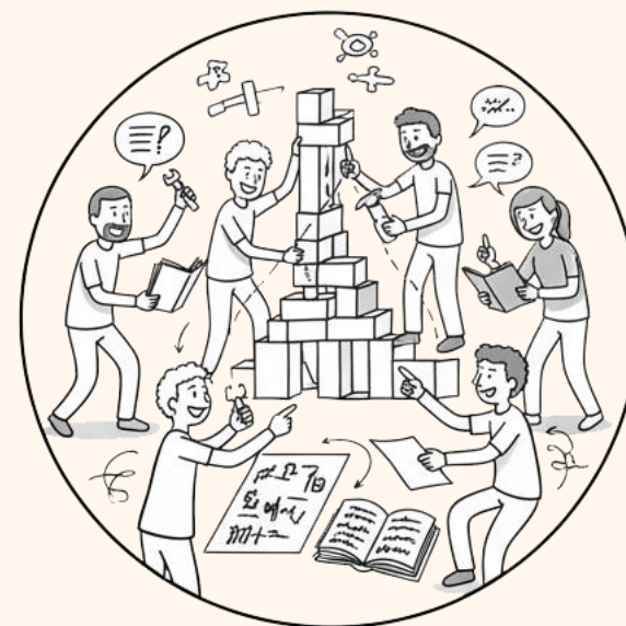
Verfahrensprototyp ohne etablierte Blaupause